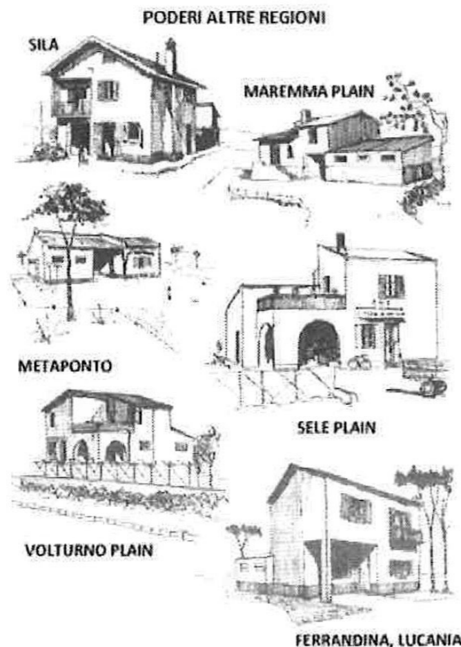
Similitudes en los tipos de casas de colonos en zonas de bonifica y de reforma agraria