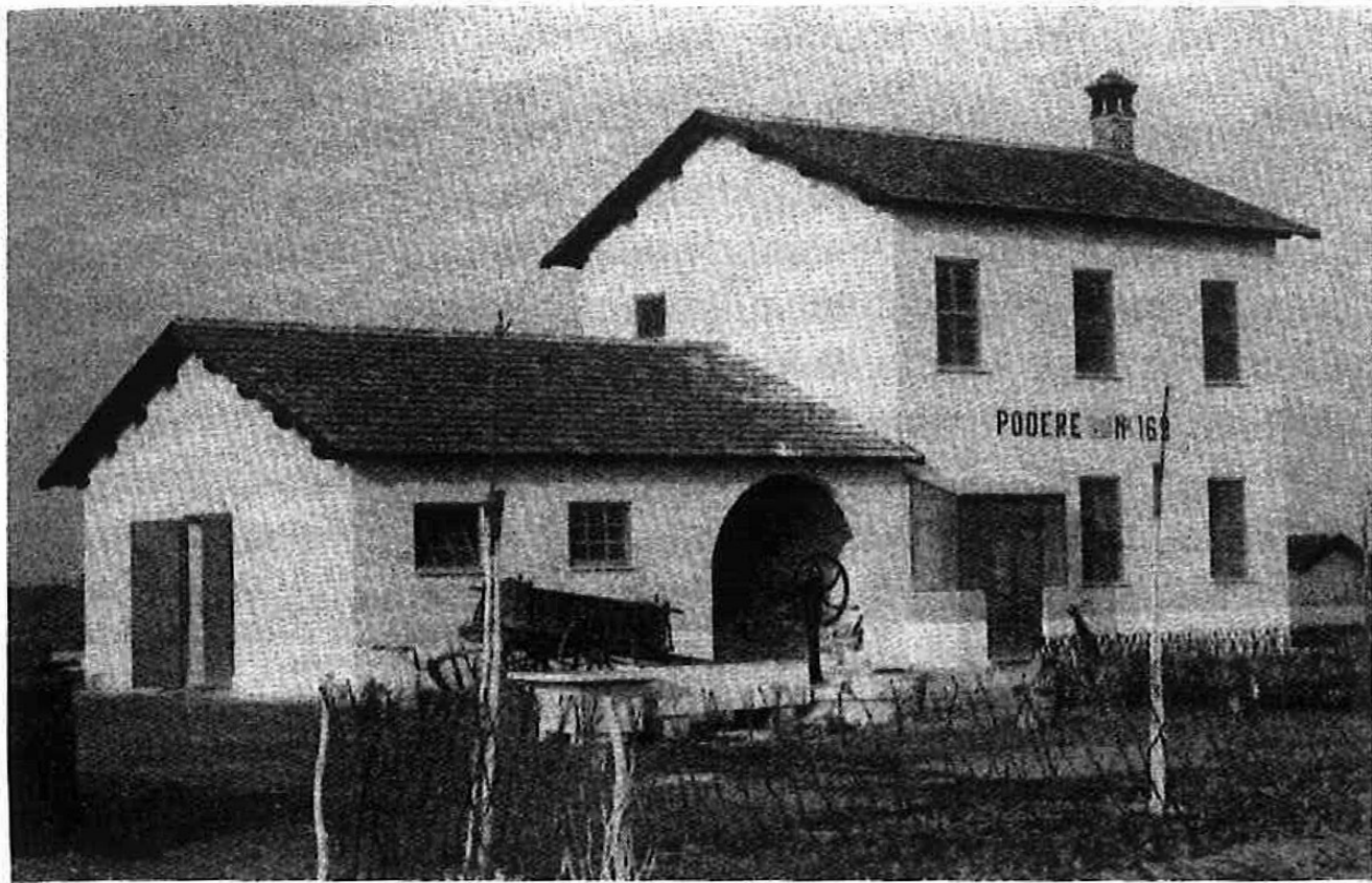
Podere de la ONG en el Agro Pontino, 1934